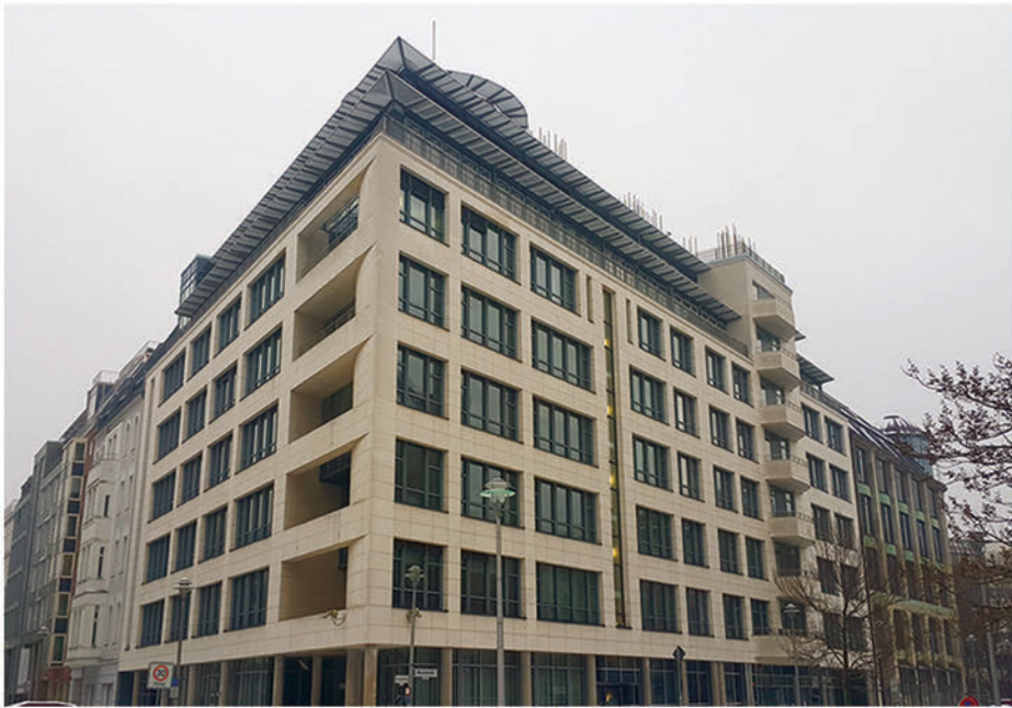
IEBC Center in Berlin